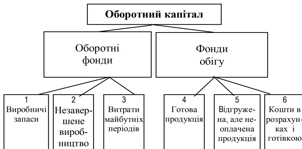
Рисунок 1.1 Склад оборотного капіталу.